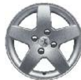
Llantas de aluminio Mónaco 15''

La información y las ilustraciones que figuran en este folleto se basan en las características técnicas vigentes en el momento de la impresión del presente documento (Marzo 2014). El equipamiento presentado en los vehículos fotografiados es de serie u opcional según las versiones. En el marco de una política de mejora constante del producto, Peugeot puede modificar sin preaviso las características técnicas, el equipamiento, las opciones y los tonos. De esta manera, este folleto constituye una información de carácter general y no un documento contractual. Para toda información complementaria, te rogamos dirigirte a tu concesionario. Fotos y equipamientos no contractuales.