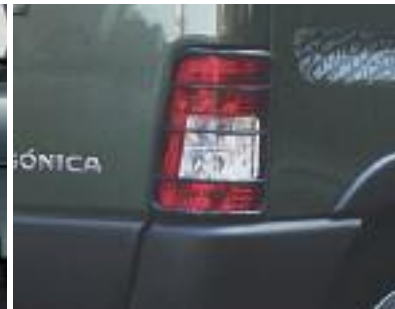
Grillas de protección de faros traseros.