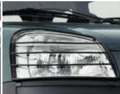
Grillas de protección faros delanteros.