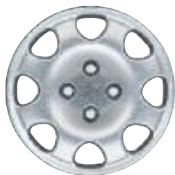
Embellecedor Cuba 14''