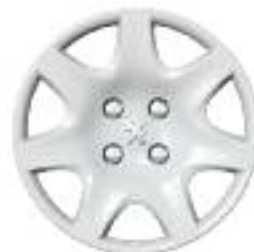
Embellecedor Pacaya 15''