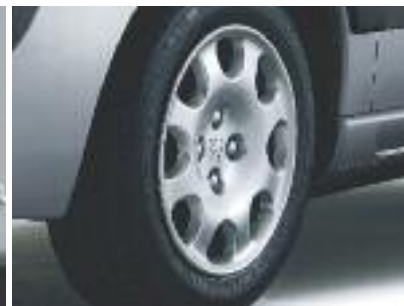
Ruedas de 14" con embellecedor.