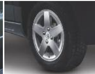
Llantas de aluminio Mónaco 15".