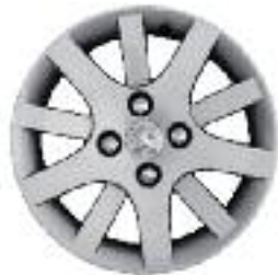
Llantas de aluminio Interlagos 15"