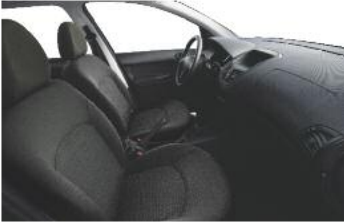
ACTIVE Tela "Oriol"