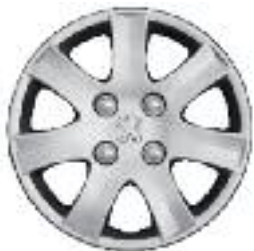
Embellecedor de llantas SPA 14"