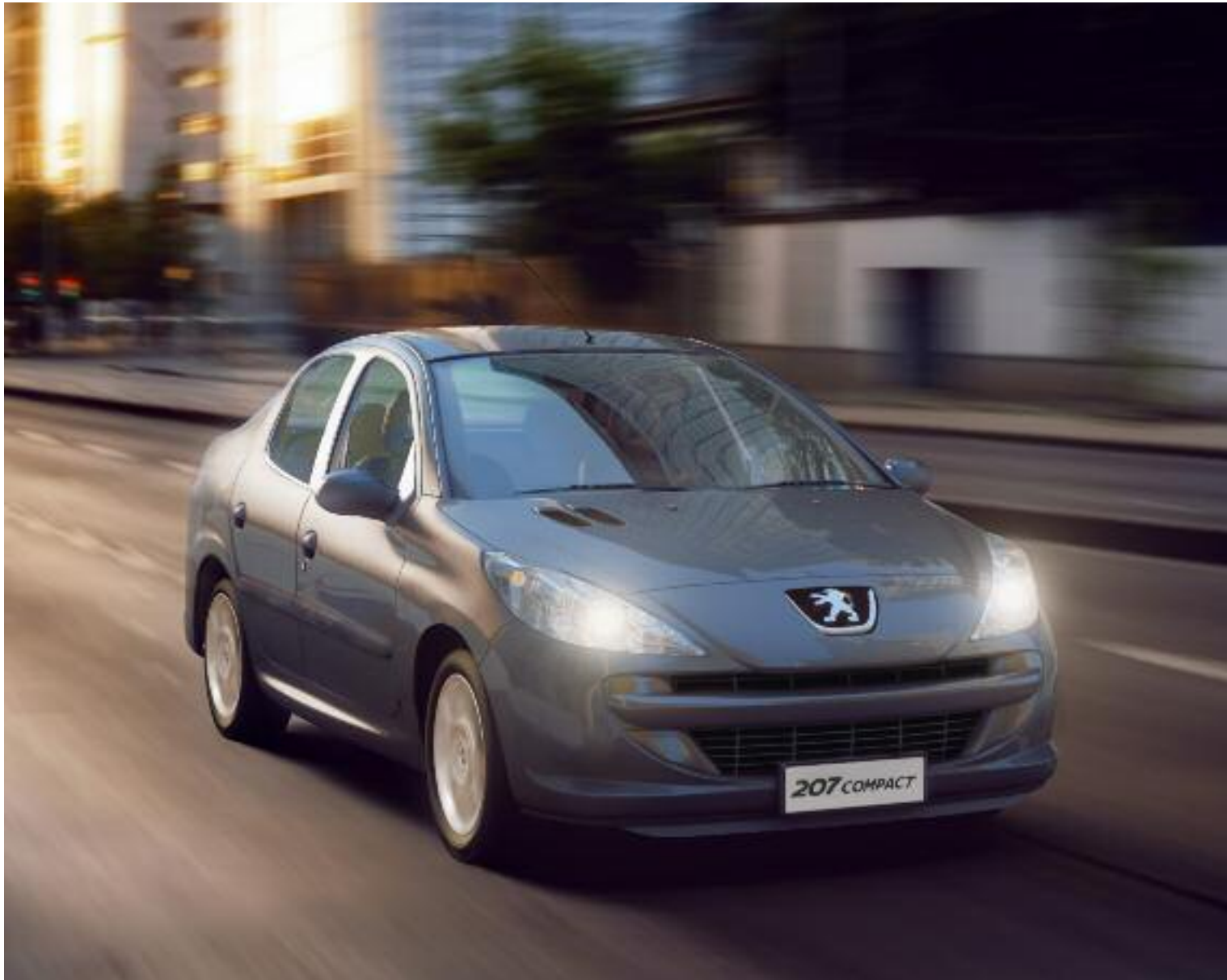
PEUGEOT 207 COMPACT SEDAN