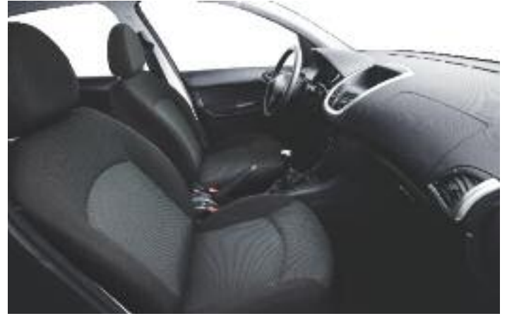
ALLURE Tela "Mixi"

La información y las ilustraciones que figuran en este folleto se basan en las características técnicas vigentes en el momento de la impresión del presente documento (Marzo 2014). El equipamiento presentado en los vehículos fotografiados es de serie u opcional según las versiones. En el marco de una política de mejora constante del producto, Peugeot puede modificar sin preaviso las características técnicas, el equipamiento, las opciones y los tonos. De esta manera, este folleto constituye una información de carácter general y no un documento contractual. Para toda información complementaria, te rogamos dirigirte a tu concesionario. Fotos y equipamientos no contractuales.